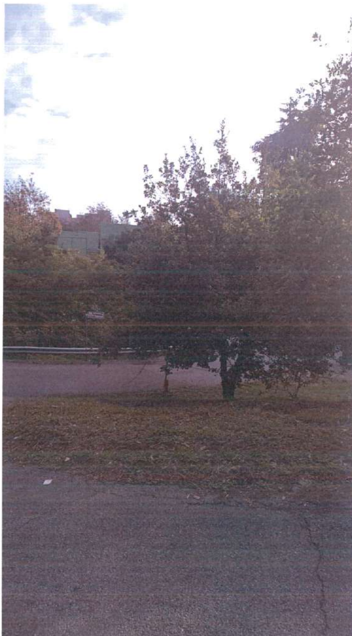
Figura 4: illuminazione pubblica