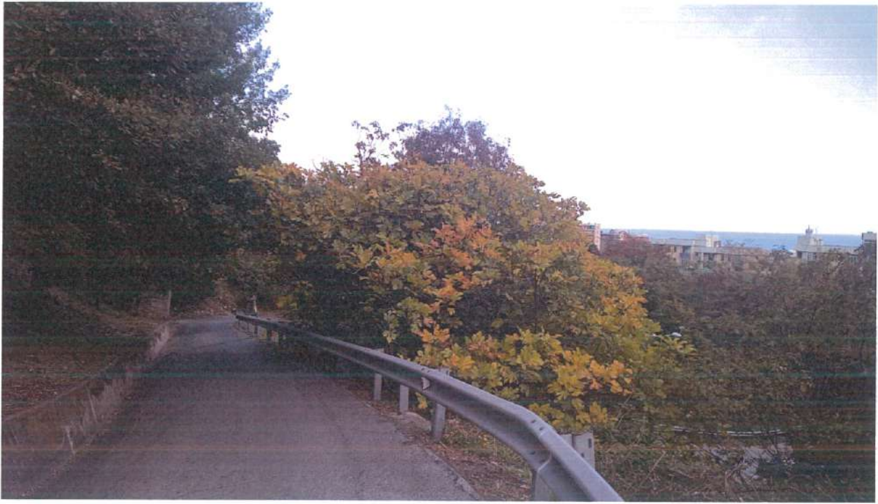
Figura 3: illuminazione pubblica