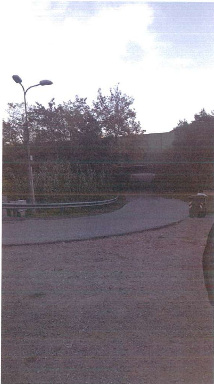
Figura 5: illuminazione pubblica