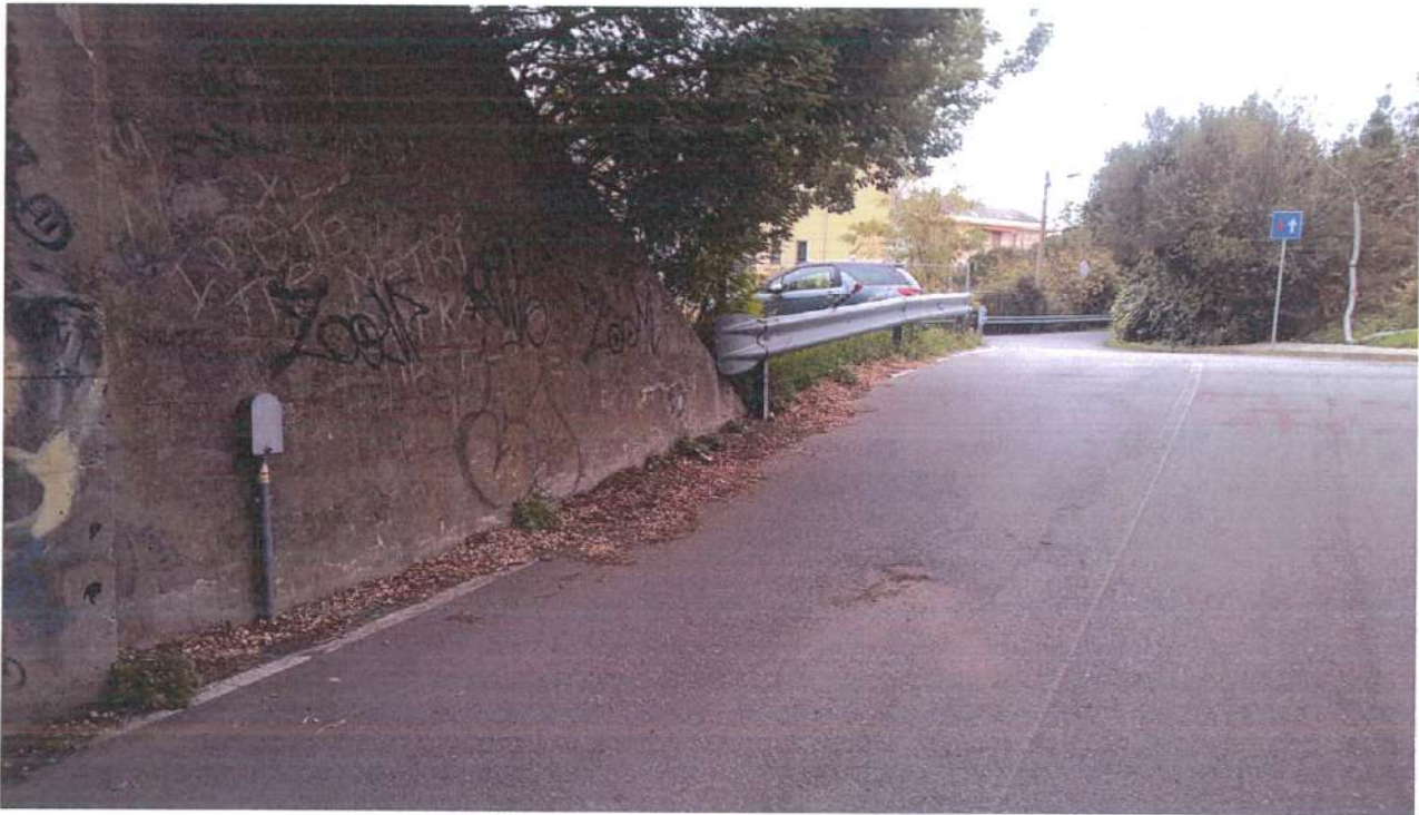
Figura 6: illuminazione pubblica