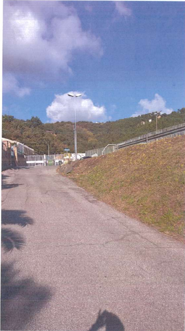
Figura 1:illuminazione pubblica