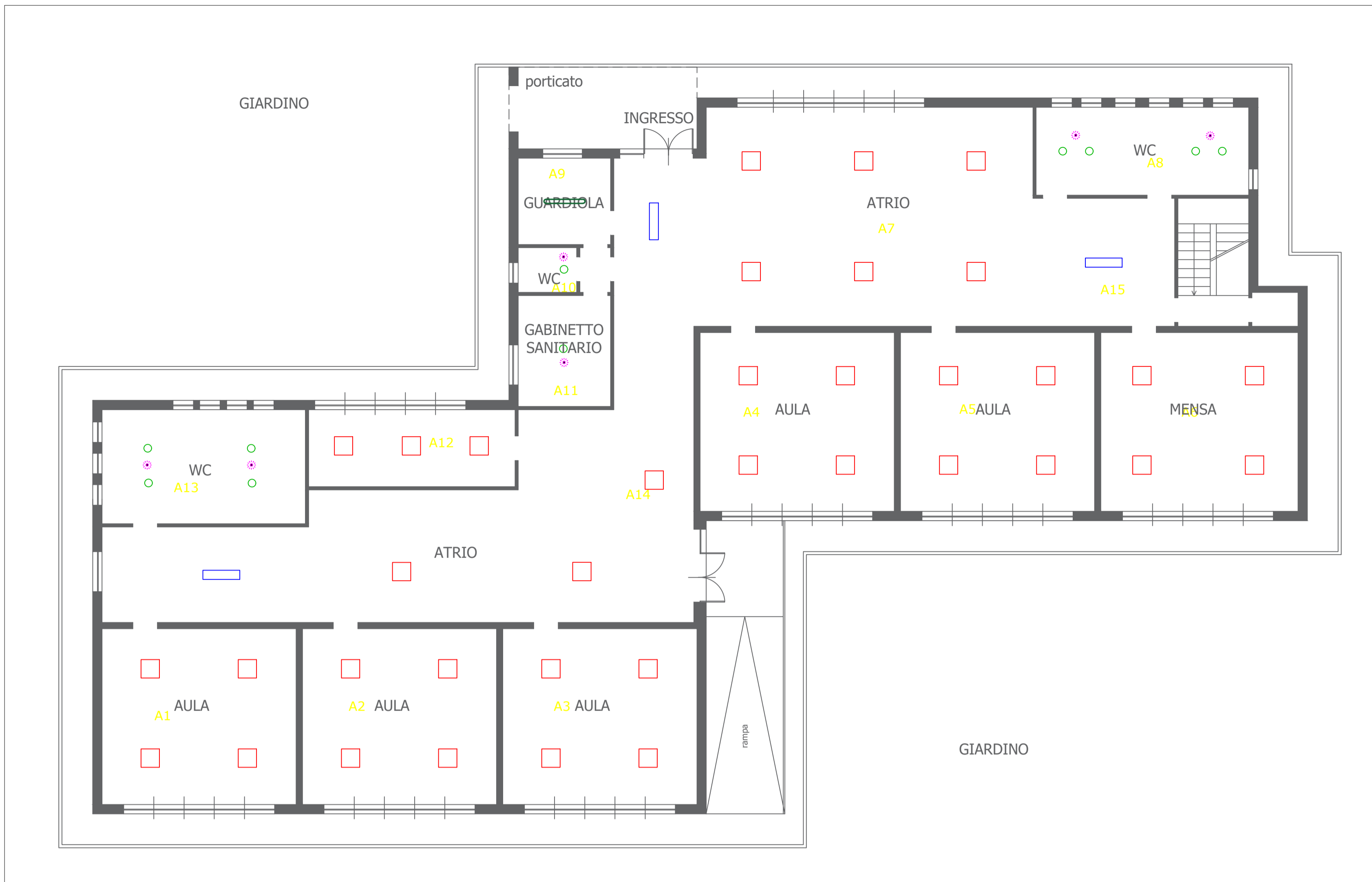
PLANIMETRIA PIANO TERRA SCALA 1:100