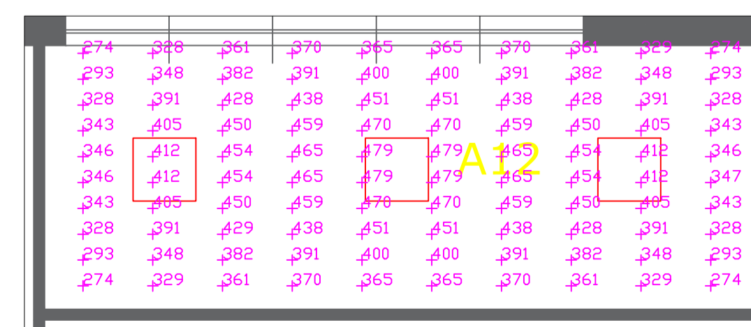
AULA SOSTEGNO - LUX A H = 0.85 M SCALA 1:50