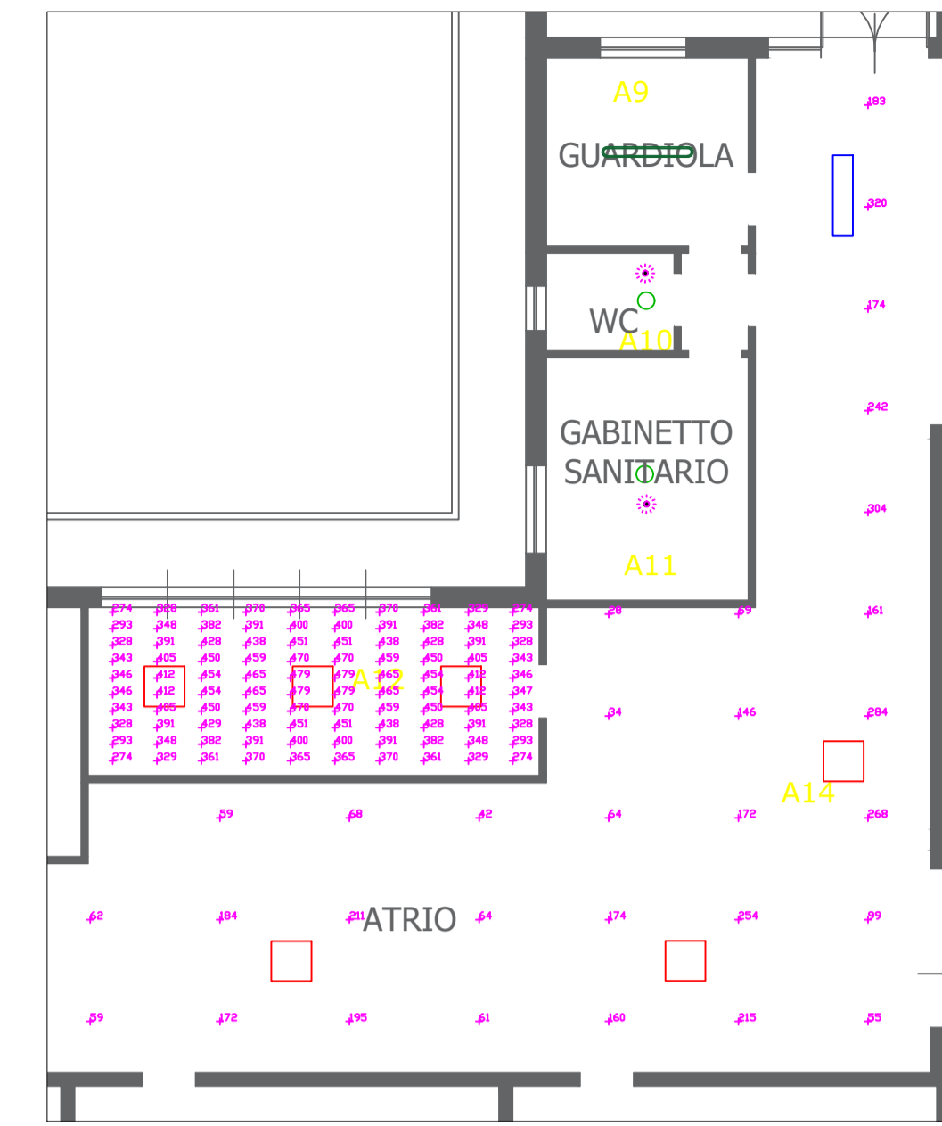
ATRIO 2 - LUX A H = 0.15 M SCALA 1:100