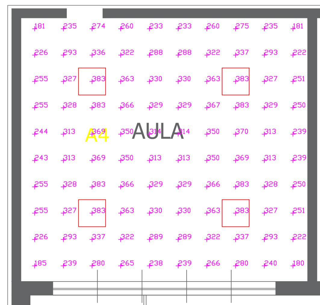
AULA LUX A H = 0.85 M SCALA 1:50