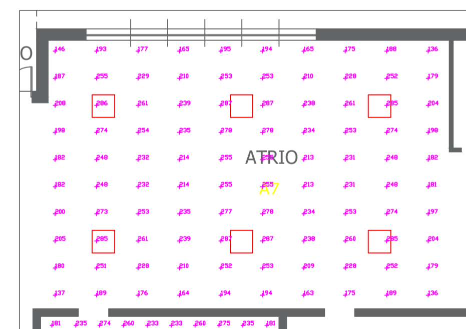
ATRIO 1 LUX A H = 0.15 M - SCALA 1:100