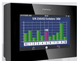
Figura 3 - Termostato CDOM

Il sistema di telecontrollo, di nuova implementazione, si interfacerà con i circuiti della struttura attraverso una divisione in zone termiche, ognuna gestita da un termostato wireless connesso ai terminali della zona stessa. Ai terminali saranno installate valvole elettroniche remote accoppiate ad un attuatore elettronico in connessione con il termostato di zona ; esse saranno configurabili nel sistema C.DOM tramite QR code. Le valvole termostattizzabili scelte sono della serie 232 Dynamic prodotte dalla Caleffi mentre gli attuatori saranno