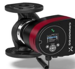
Figura 2 – Pompa ad inverter