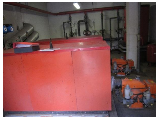
Figura 1 - Generatori esistenti

Si precisa che maggiori dettagli tecnici sono riportati negli elaborati 050-2019-065-MEC-E-PLN-014-00 e 050-2019-065-MEC-E-SCM-013-02.