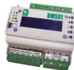
Figura 5 - Centralina

Il sistema di telecontrollo sarà composto da una centralina di gestione che opererà da interfaccia fra i componenti della centrale termica e i termostati ambiente all'interno dell'edificio; essa presenterà una sonda di temperatura esterna e un modem di comunicazione per telegestione da remoto. In centrale termica saranno installate delle sonde a contatto e ad immersione: le prime definiscono un delta di temperatura che consentono il funzionamento del sistema sulla mandata e sul ritorno dei circuiti, le seconde saranno montate sul pozzetto di misura e avranno il compito di fornire misure più precise per la gestione dei componenti, quali separatore idraulico, scambiatore di calore e accumulo ACS.