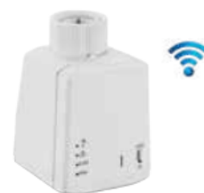
Figura 4 - Attuatore wireless

Il sistema di telecontrollo, di nuova implementazione, si interfacerà con i circuiti della struttura attraverso una divisione in zone termiche, ognuna gestita da un termostato wireless connesso ai terminali della zona stessa. Ai terminali saranno installate valvole elettroniche remote accoppiate ad un attuatore elettronico in connessione con il termostato di zona ; esse saranno configurabili nel sistema C.DOM tramite QR code. Le valvole termostattizzabili scelte sono della serie 232 Dynamic prodotte dalla Caleffi mentre gli attuatori saranno