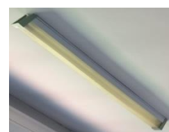
Figura 6 - Corpi illuminanti da sostituire

Maggiori informazioni sono riportate nell'elaborato 050-2019-065-ELE-E-ILL-018-01.